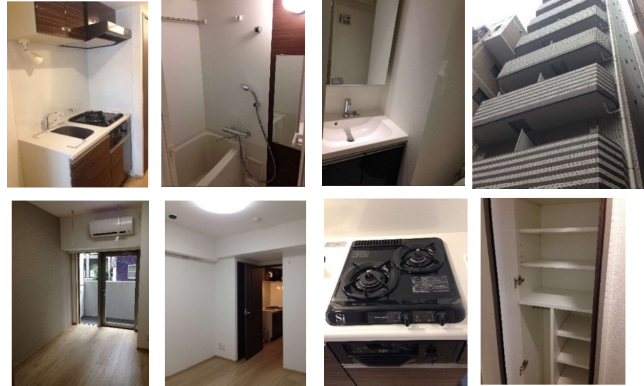
*写真は別部屋のものです。

*バス・トイレ別*システムキッチン*2口コンロ室内洗濯機置き場*エアコン*角部屋 室内冷蔵庫置き場*独立洗面台*クローゼットオートロック*ガス給湯器*バルコニー*浴室シャワー付*フローリング(2重床)*防犯カメラ*TVモニター付きインターホン*シューズBOX*浴室換気乾燥機*照明器具*BS/CS*宅配BOX*SOHO利用OK*ペット1匹OK(50cm以下/10kg以下)法人OK(法