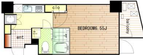
*バルコニー向き:北東