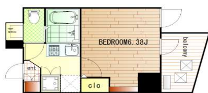
*バルコニー向き:北東

A1・A2 type 5.78帖 / B type 6.38帖 / C type B type C