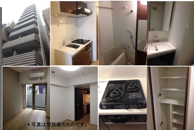
*写真は別部屋のものです。

*バス・トイレ別*システムキッチン*2口コンロ室内洗濯機置き場*エアコン* 角部屋 室内冷蔵庫置き場*独立洗面台*クローゼットオートロック*ガス給湯器*バル コニー*浴室シャワー付*フローリング(2重床)*防犯カメラ*TVモニター 付きインターホン*シューズBOX*浴室換気乾燥機*照明器具*BS/CS*宅配 BOX*SOHO利用OK*ペット1匹OK(50cm以下/10kg以下)法人OK(法人 登記OK)*ゴミ出し24h可*セキュリティALSO加入済*光wi-fi対応