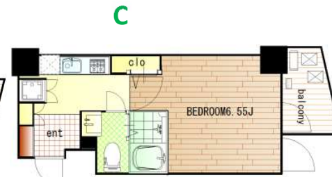
*バルコニー向き:北東