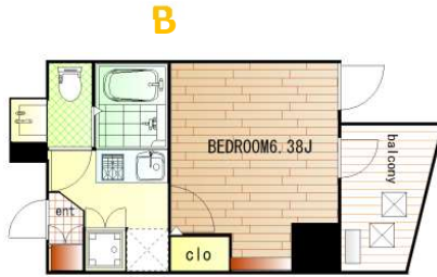
*バルコニー向き:北東